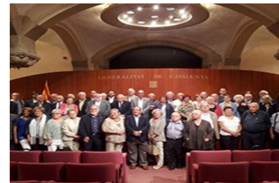
Acte de la constitució del Consell de la Gent Gran de Catalunya

Serà un plaer compta amb vosaltres. Us hi esperem!